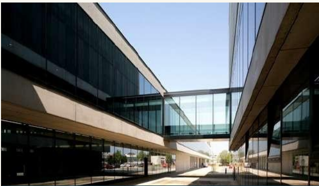
ФАКУЛЬТЕТ ЭКОНОМИКИ И УПРАВЛЕНИЯ В УНИВЕРСИТЕТЕ В ПАРДУБИЦЕ