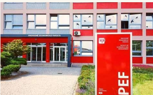
ФАКУЛЬТЕТ БИЗНЕСА И ЭКОНОМИКИ В ЧЕШСКОМ АГРОТЕХНИЧЕСКОМ УНИВЕРСИТЕТЕ