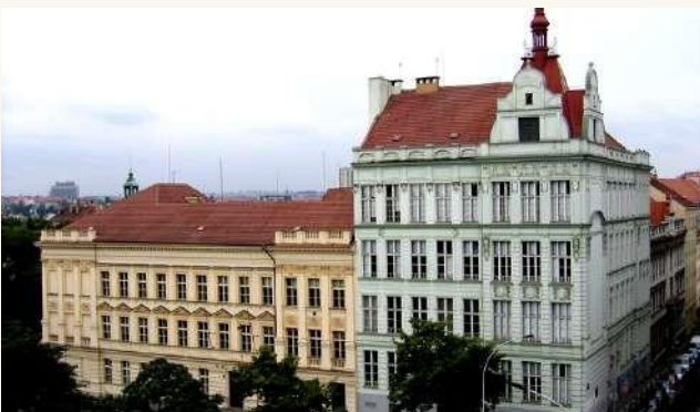
УНИВЕРСИТЕТ ФИНАНСОВ И УПРАВЛЕНИЯ | VŠFS (ЧАСТНЫЙ ВУЗ)