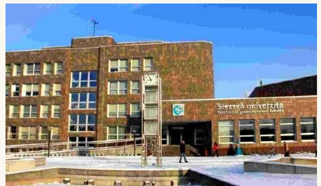
ФАКУЛЬТЕТ ДЕЛОВОГО АДМИНИСТРИРОВАНИЯ В СИЛЕЗСКОМ УНИВЕРСИТЕТЕ В ОПАВЕ