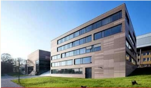
СОЦИАЛЬНО-ЭКОНОМИЧЕСКИЙ ФАКУЛЬТЕТ В УНИВЕРСИТЕТЕ ПУРКИНЕ В УСТИ-НАД-ЛАБЕМ