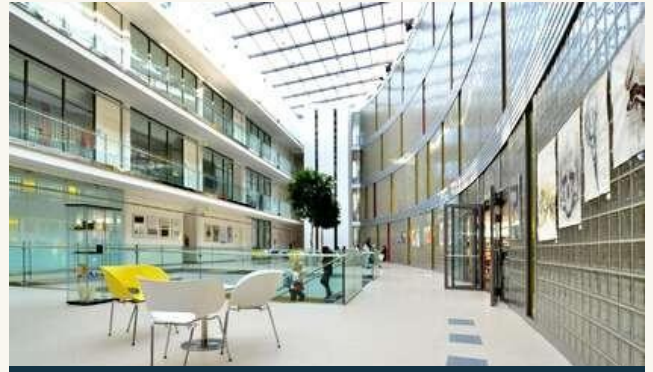
ФАКУЛЬТЕТ МЕНЕДЖМЕНТА И ЭКОНОМИКИ В УНИВЕРСИТЕТЕ ТОМАША БАТИ В ЗЛИНЕ