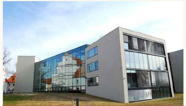
УНИВЕРСИТЕТ ШКОДА АВТО | SAVS (ЧАСТНЫЙ ВУЗ)