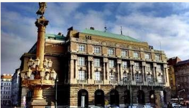
ФАКУЛЬТЕТ СОЦИАЛЬНЫХ НАУК В КАРЛОВОМ УНИВЕРСИТЕТЕ В ПРАГЕ