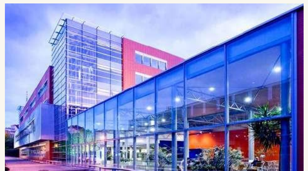
ВЫСШАЯ ШКОЛА ЭКОНОМИКИ (VŠE)