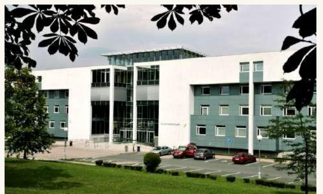
ФАКУЛЬТЕТ ПРЕДПРИНИМАТЕЛЬСТВА В БРЕНСКОМ ТЕХНИЧЕСКОМ УНИВЕРСИТЕТЕ (VUT)