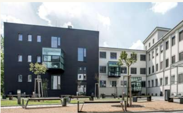
МЕДИЦИНСКИЙ ФАКУЛЬТЕТ ОСТРАВСКОГО УНИВЕРСИТЕТА