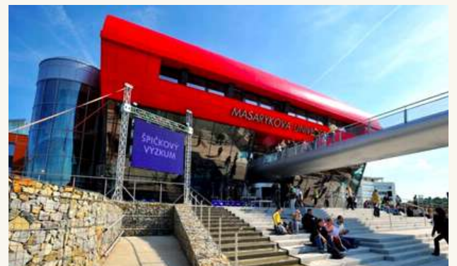
МЕДИЦИНСКИЙ ФАКУЛЬТЕТ МУ В БРНО