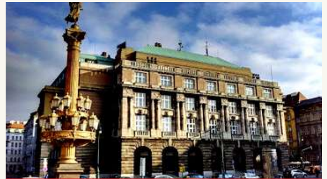
КАРЛОВ УНИВЕРСИТЕТ В ПРАГЕ