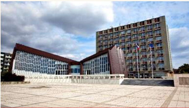
ФАКУЛЬТЕТ БИМЕДИЦИНЫ В ČVUT В ПРАГЕ