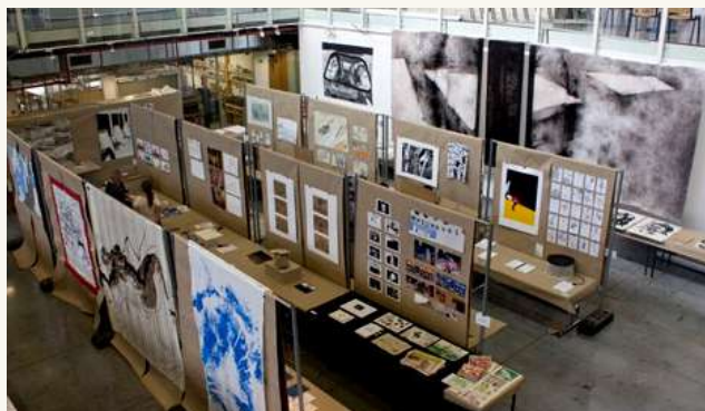
ФАКУЛЬТЕТ ДИЗАЙНА И ИСКУССТВ ЗАПАДНОЧЕШСКОГО УНИВЕРСИТЕТА В ПЛЬЗЕНИ