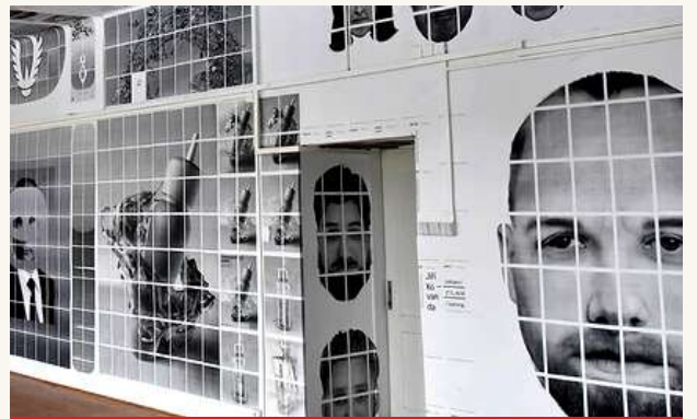
ФАКУЛЬТЕТ ИЗОБРАЗИТЕЛЬНЫХ ИСКУССТВ ТЕХНИЧЕСКОГО УНИВЕРСИТЕТА В БРНО.