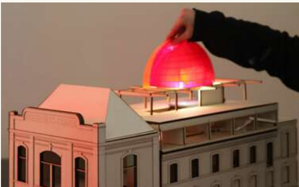
ВЫСШАЯ ШКОЛА ПРИКЛАДНОГО ИСКУССТВА В ПРАГЕ (UMPRUM).