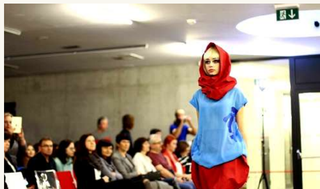
ФАКУЛЬТЕТ ТЕКСТИЛЯ ТЕХНИЧЕСКОГО УНИВЕРСИТЕТА В ЛИБЕРЕЦЕ