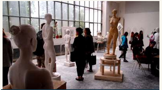
АКАДЕМИЯ ИЗОБРАЗИТЕЛЬНЫХ ИСКУССТВ В ПРАГЕ (AVU).