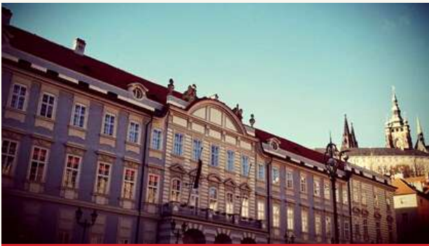
АКАДЕМИЯ ИСПОЛНИТЕЛЬСКИХ ИСКУССТВ В ПРАГЕ (AMU).