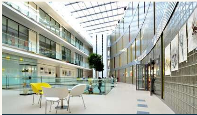
ФАКУЛЬТЕТ МУЛЬТИМЕДИАЛЬНОЙ КОММУНИКАЦИИ УНИВЕРСИТЕТА ТОМАША БАТИ В ЗЛИНЕ