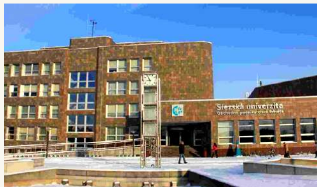
СИЛЕЗСКИЙ УНИВЕРСИТЕТ В ОПАВЕ