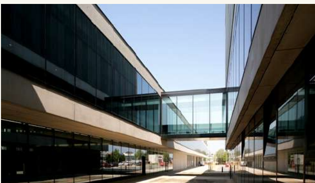
УНИВЕРСИТЕТ В ПАРДУБИЦЕ