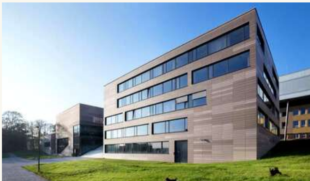
УНИВЕРСИТЕТ ПУРКИНЕ В УСТИ-НАД-ЛАБЕМ