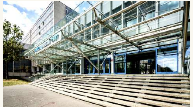
ЧЕШСКИЙ ТЕХНИЧЕСКИЙ УНИВЕРСИТЕТ В ПРАГЕ (ČVUT)