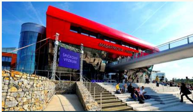
МАСАРИКОВ УНИВЕРСИТЕТ В БРНО