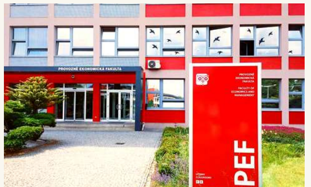
ЧЕШСКИЙ АГРОТЕХНИЧЕСКИЙ УНИВЕРСИТЕТ (ČZU)