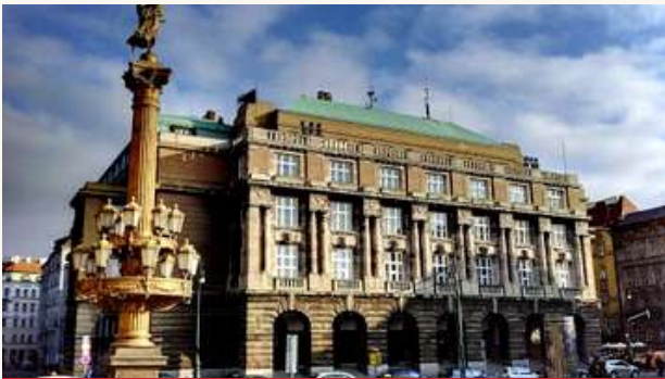
КАРЛОВ УНИВЕРСИТЕТ В ПРАГЕ