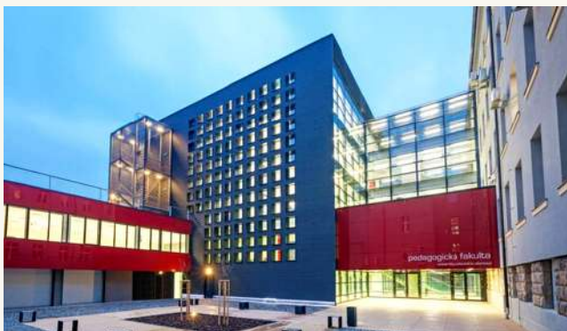
УНИВЕРСИТЕТ ПАЛАЦКОГО В ОЛОМОУЦЕ