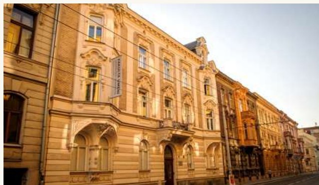
ОСТРАВСКИЙ УНИВЕРСИТЕТ В ОСТРАВЕ