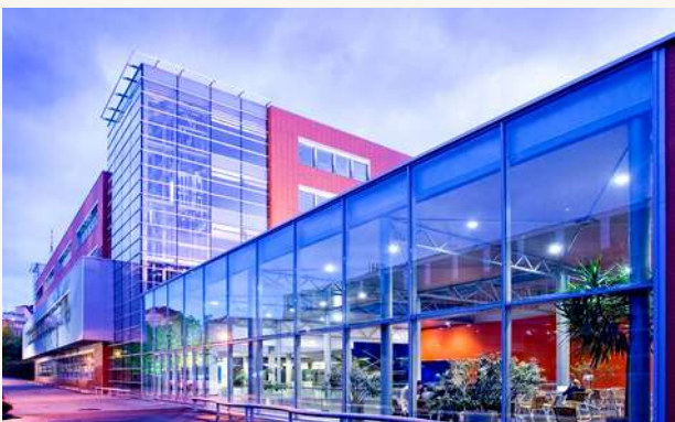
ВЫСШАЯ ШКОЛА ЭКОНОМИКИ (VŠE)